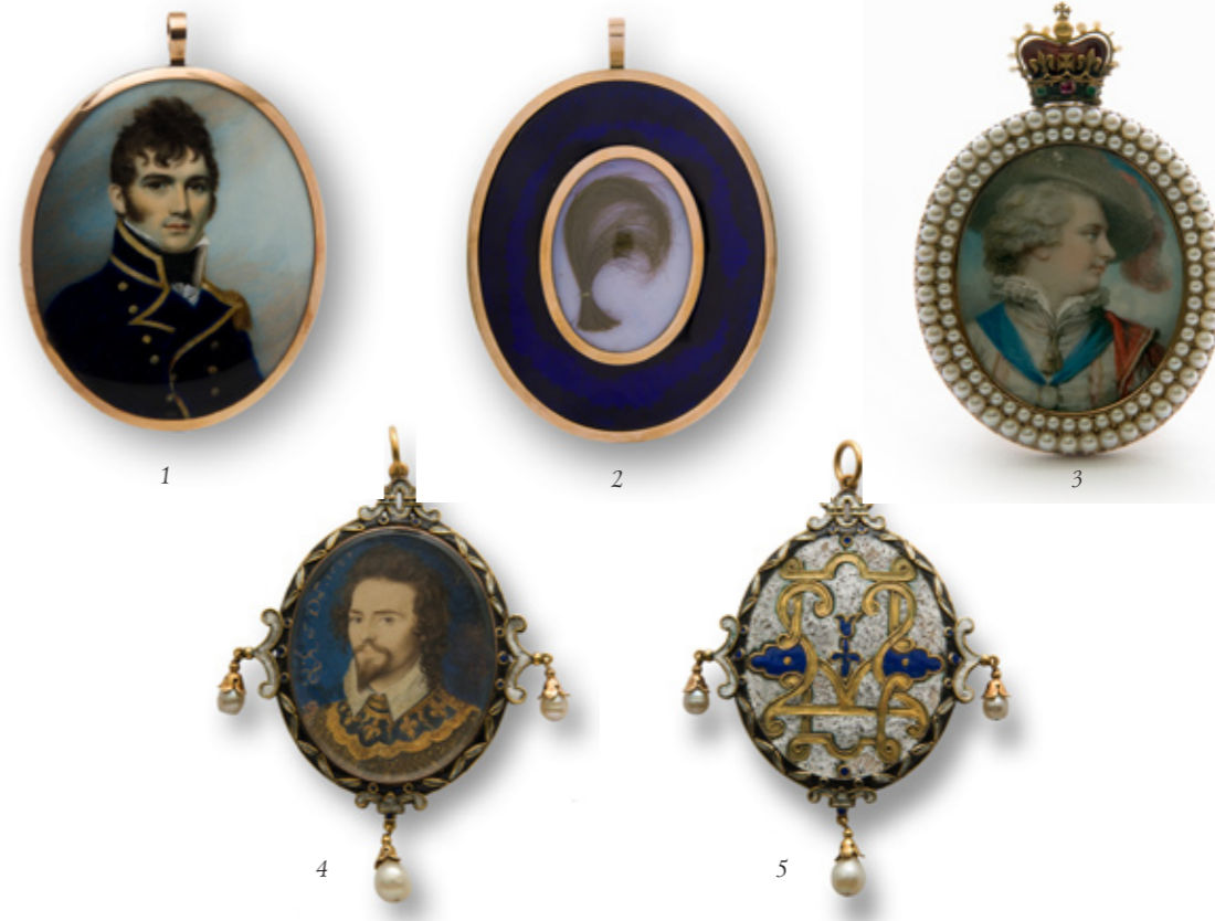
◀ 1,2: Джордж Энгельхерт (1750–1829). Мужской портрет. Акварель, кость. 1791. Фонд Т.Зубовой, Буэнос-Айрес, Аргентина

Искусство миниатюрной живописи затронуло самые разнообразные жанры: здесь можно встретить сельские и городские пейзажи, батальные сцены, но ведущая роль принадлежит, конечно же, портрету. Миниатюра больше, чем любой другой вид искусства, была непосредственно связана с человеком, с его повседневной жизнью. Изысканные, виртуозно исполненные маленькие портреты стояли на