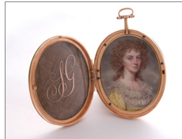
▼ Сэмюэл Котс (1734-1818) Портрет Принцессы Амелии-Софии. Акварель, кость. 1776. Фонд Т.Зубовой, Буэнос-Айрес, Аргентина